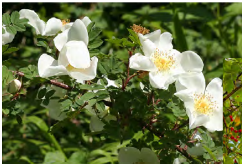
Wildrose, Nur Wildrosen bilden Hagebutten im Herbst!